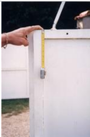
Photo du repère

Altitude calculée de l'eau (en m) : 67.586