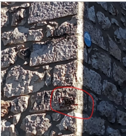
zoom sur repère 1958