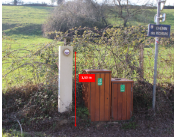
Sèvre Niortaise, pont de Surimeau, chemin des pêcheurs

Coordonnées WGS84 : X: -0.45765310 / Y: 46.35474800