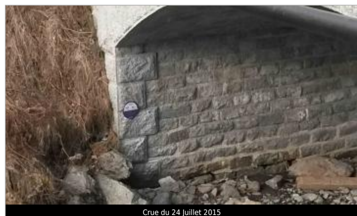
Crue du 24 Juillet 2015