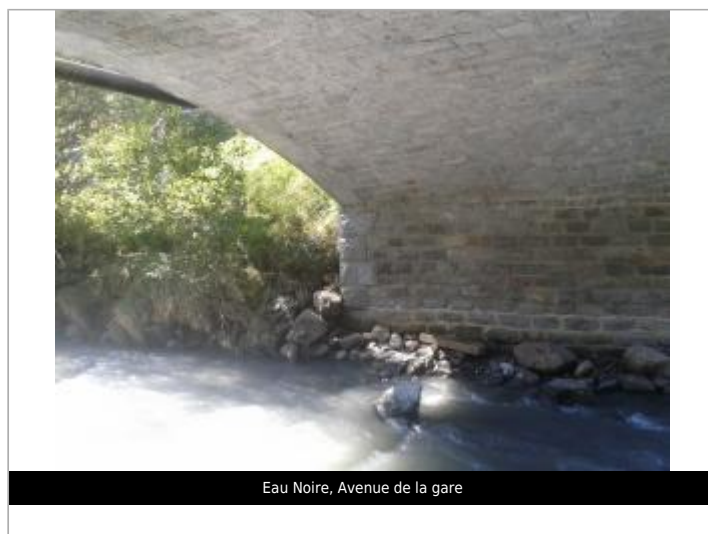
Eau Noire, Avenue de la gare