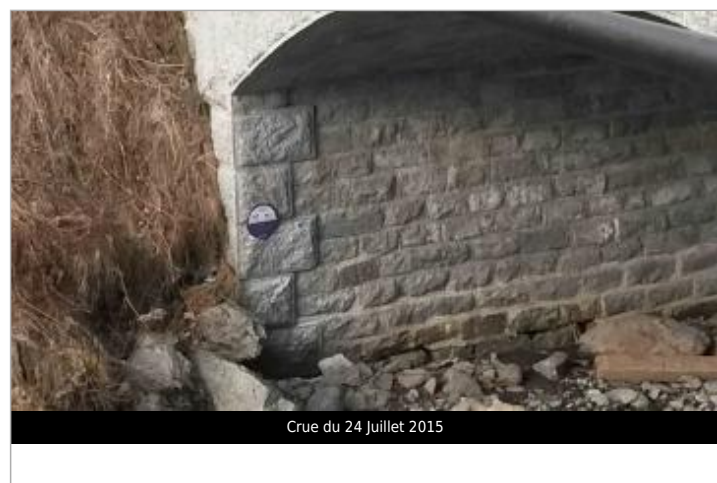
Crue du 24 Juillet 2015