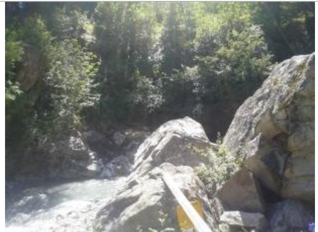
Torrent eau de Bérard, près de la cascade