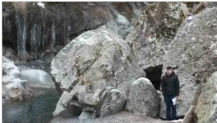
Crue du 24 Juillet 2015