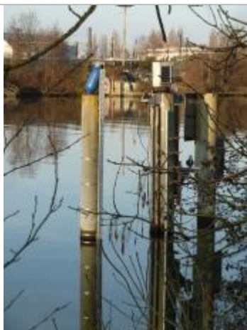
Echelle de la station de Creil (nouveau positionnement)