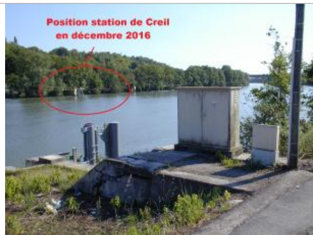
Station de Creil (nouveau positionnement)