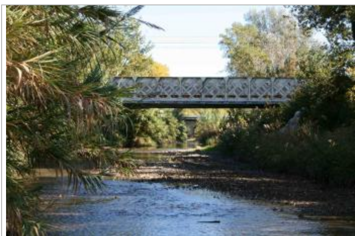
Pont rail SNCF au niveau des Ratacans. Vue depuis le lit mineur.