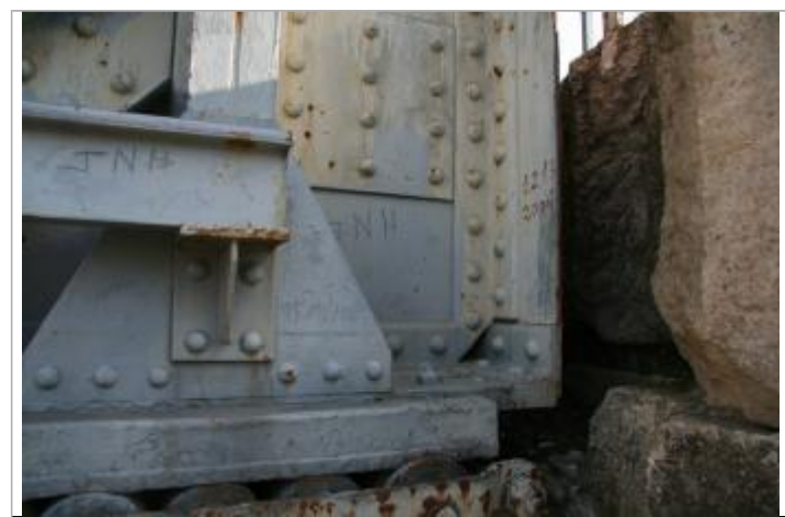
Marquage à la peinture sur le pilier aval côté Ratacan. Auteur: Actions-Coulon