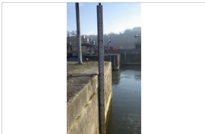
Echelle aval de l'écluse de Creil à St Leu d'Esserent