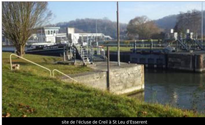
site de l'écluse de Creil à St Leu d'Esserent