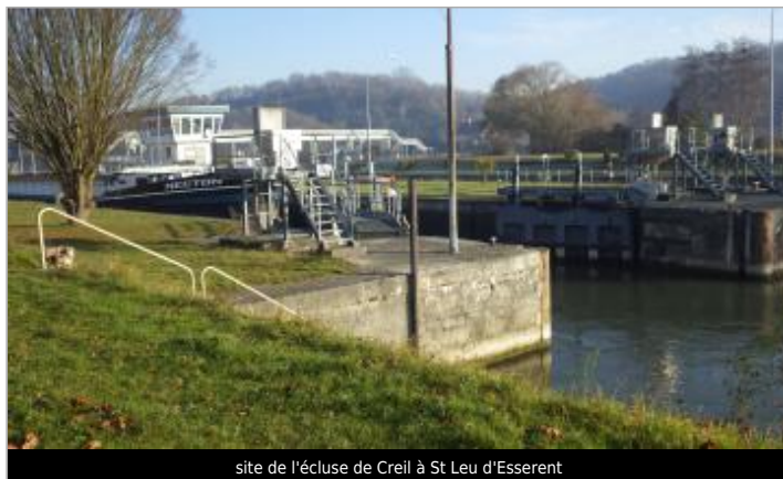
site de l'écluse de Creil à St Leu d'Esserent