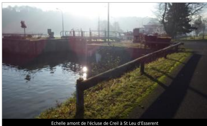
Echelle amont de l'écluse de Creil à St Leu d'Esserent