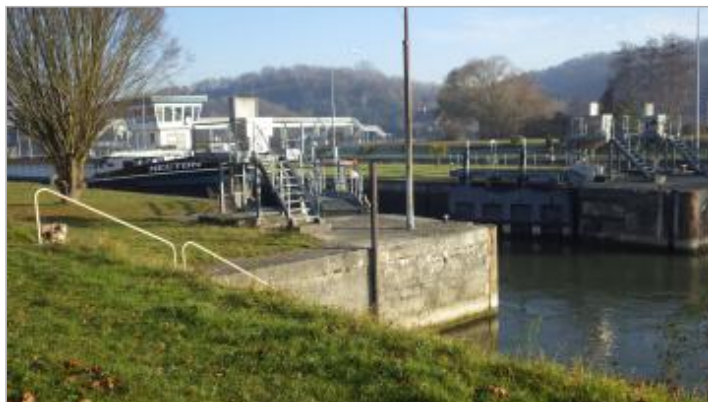
site de l'écluse de Creil à St Leu d'Esserent