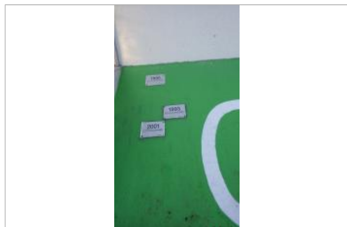
plaque 2001 à 5.99 m