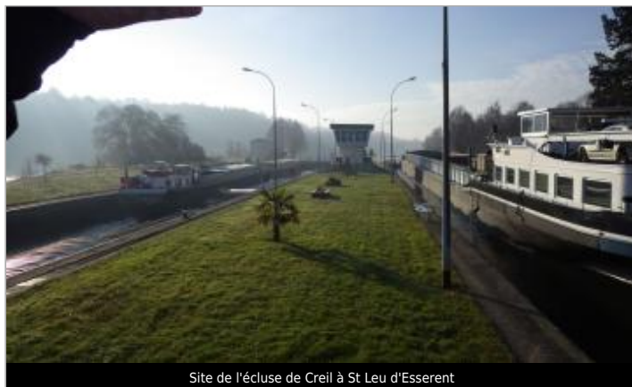
Site de l'écluse de Creil à St Leu d'Esserent