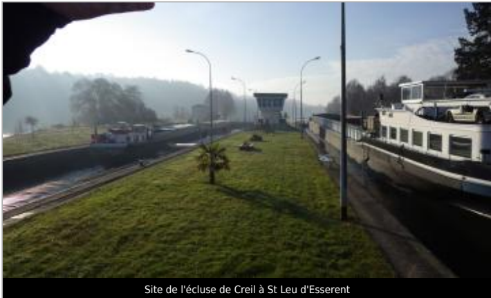
Site de l'écluse de Creil à St Leu d'Esserent