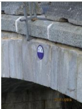
Crue du 14 Juillet 1987