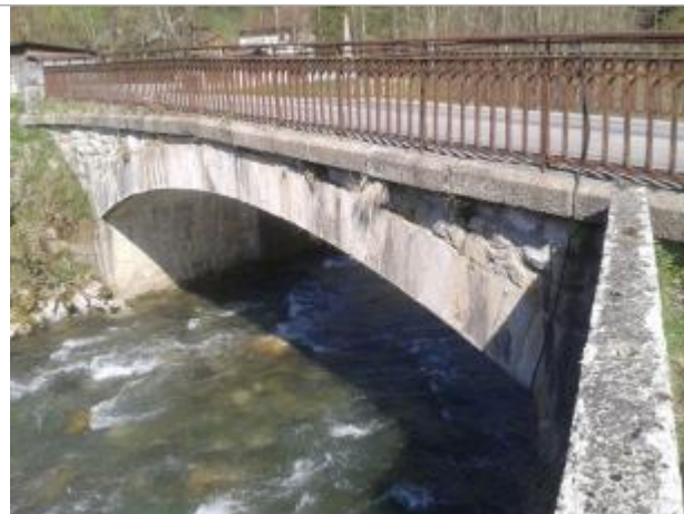
Le Borne, pont du Clef