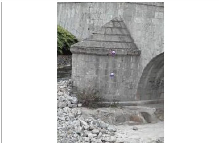
crue du 22 septembre 1968