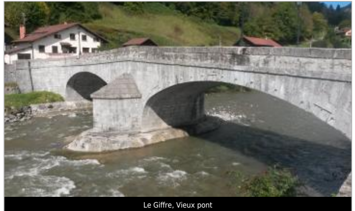
Le Giffre, Vieux pont