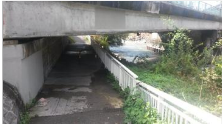
Le Giffre, pont neuf