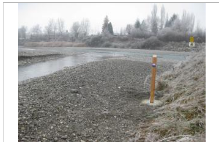
crue du 1-4 mai 2015