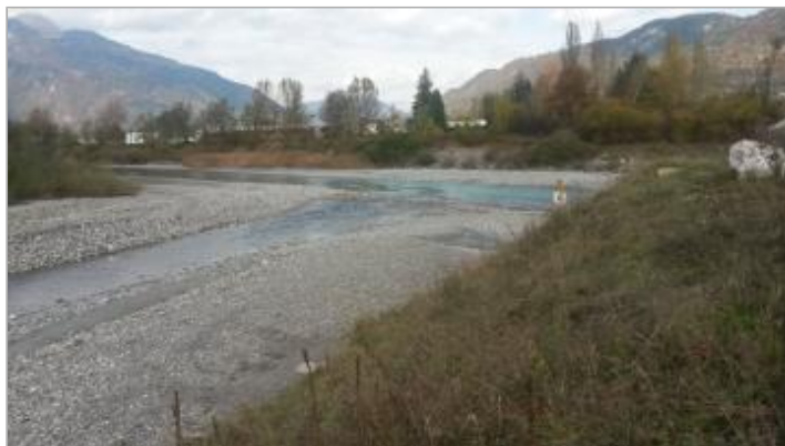
Rivière de l'Arve, confluence avec le foron du reposoir