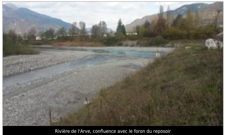
Rivière de l'Arve, confluence avec le foron du reposoir