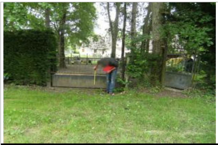
Repère et site

GÉOLOCALISATION Coordonnées WGS84 : X: 1.74763700 / Y: 47.35377300 Coordonnées RGF93 (Lambert 93) X: 605464.53 / Y: 6695576.34 Coordonnées RGF93 (ETRS89) : X: 1.747637 / Y: 47.353773 Code Hydro: K6-0250 Rive de référence: Gauche