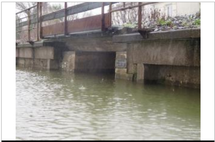
Niveau eau au pic