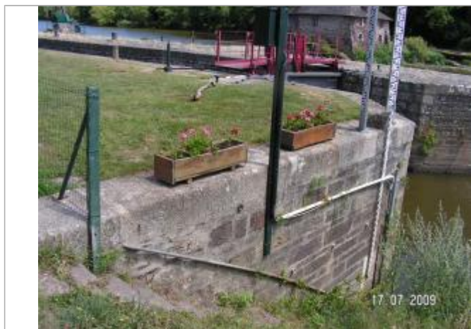
Echelle limnimétrique sur bajoyer aval de l'écluse du Boel

Altitude calculée de l'eau (en m) : 16.327 m