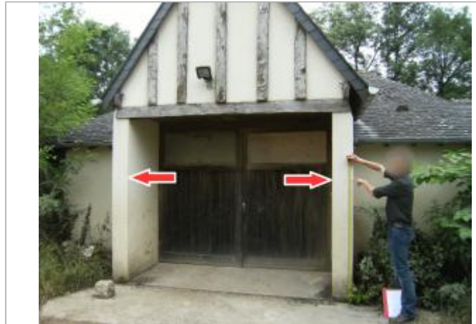
Vue du site et du repère de la crue de 2016

Coordonnées WGS84 : X: 1.72820530 / Y: 47.34974740