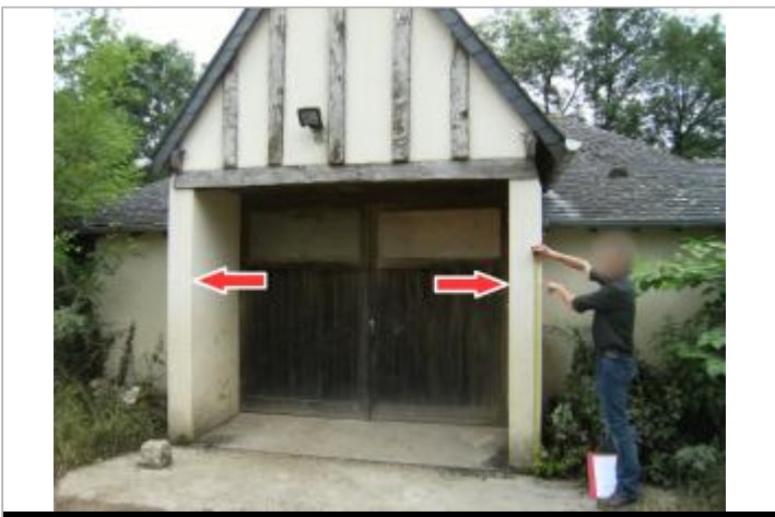
Vue du site et du repère de la crue de 2016

GÉOLOCALISATION Coordonnées WGS84 : X: 1.72820530 / Y: 47.34974740 Coordonnées RGF93 (Lambert 93) X: 603990.64 / Y: 6695152.67 Coordonnées RGF93 (ETRS89) : X: 1.7282053 / Y: 47.3497474 Code Hydro: K6--0250 Rive de référence: Droite