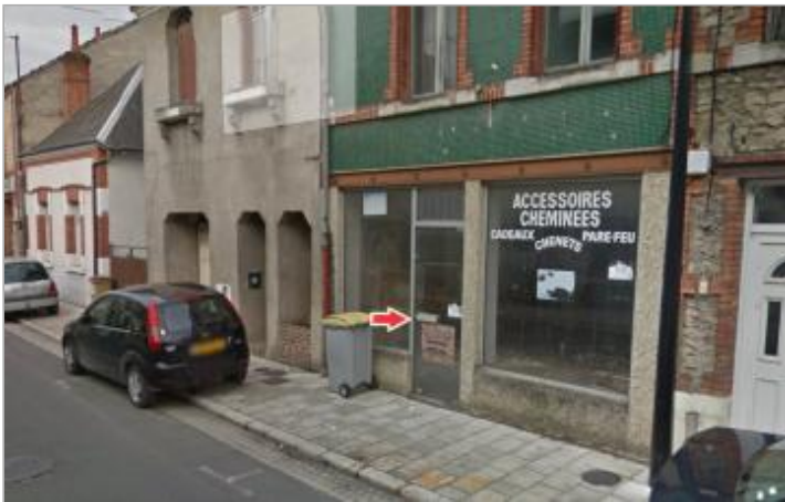
Vue d'ensemble du site

GÉOLOCALISATION Coordonnées WGS84 : X: 1.74214200 / Y: 47.35407100 Coordonnées RGF93 (Lambert 93) X: 605050.3 / Y: 6695616.04 Coordonnées RGF93 (ETRS89) : X: 1.742142 / Y: 47.354071 Code Hydro: K6-0250 Rive de référence: Gauche