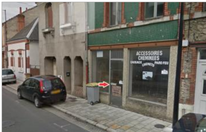
Vue d'ensemble du site