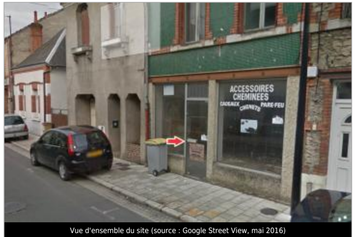
Vue d'ensemble du site

Coordonnées WGS84 : X: 1.74214200 / Y: 47.35407100