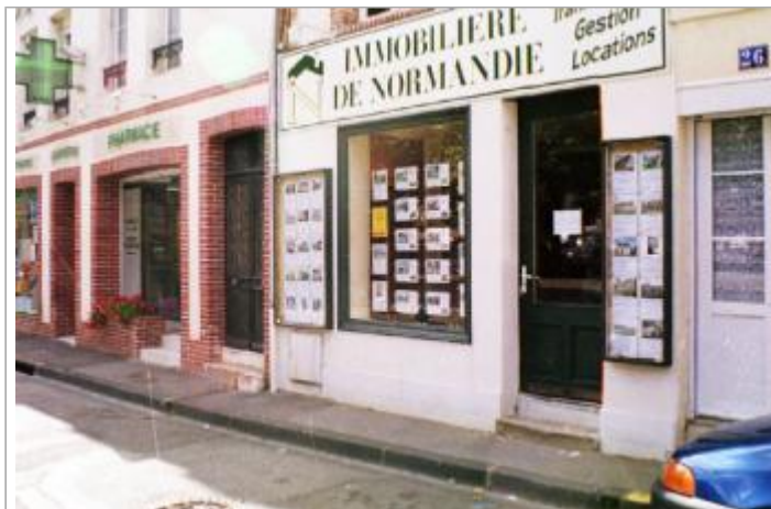
Site et du repère de la crue de juin 2016

Coordonnées WGS84 : X: 1.74856610 / Y: 47.35706400