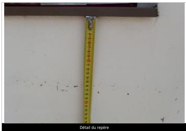
Détail du repère

Altitude calculée de l'eau (en m) : 87.48 m