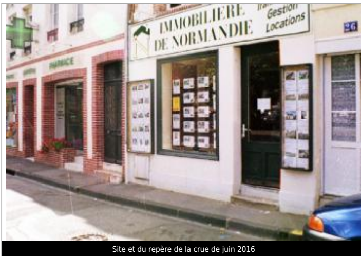
Site et du repère de la crue de juin 2016

GÉOLOCALISATION Coordonnées WGS84 : X: 1.74856610 / Y: 47.35706400 Coordonnées RGF93 (Lambert 93) X: 605540.45 / Y: 6695940.76 Coordonnées RGF93 (ETRS89) : X: 1.7485661 / Y: 47.357064 Code Hydro: K6--0250 Rive de référence: Droite