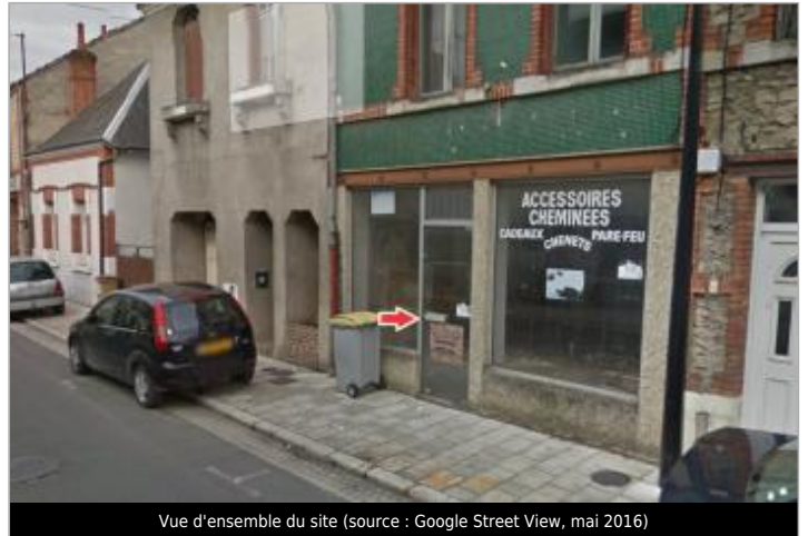
Vue d'ensemble du site