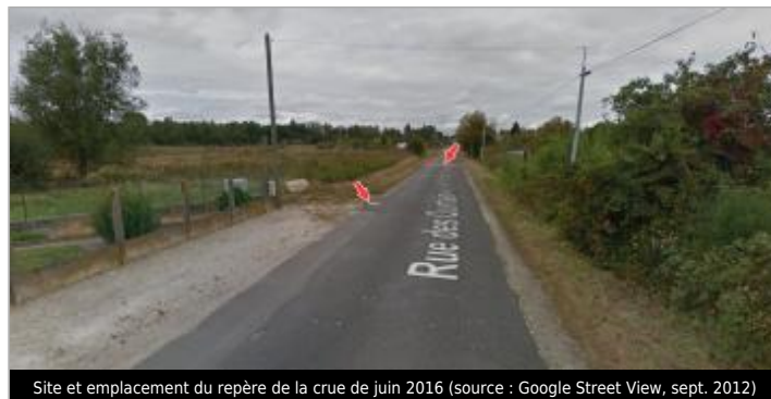
Site et emplacement du repère de la crue de juin 2016

GÉOLOCALISATION Coordonnées WGS84 : X: 1.73741000 / Y: 47.35247700 Coordonnées RGF93 (Lambert 93) X: 604690.3 / Y: 6695444.69 Coordonnées RGF93 (ETRS89) : X: 1.73741 / Y: 47.352477 Code Hydro: K6--0250 Rive de référence: Gauche