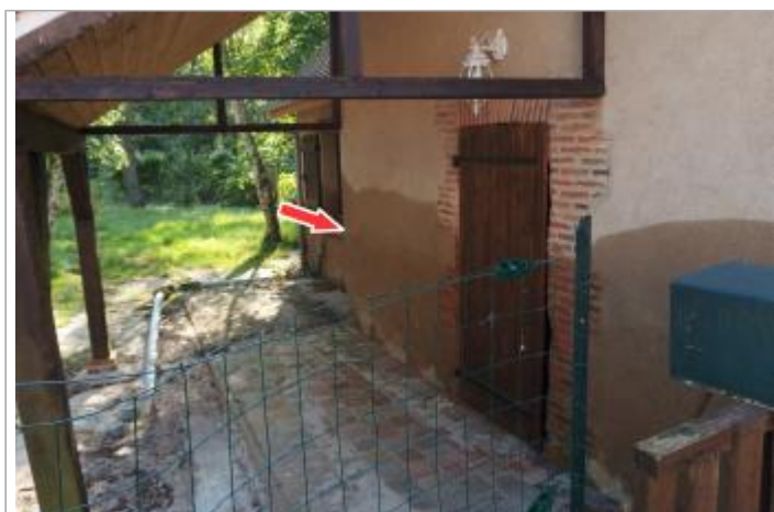
Vue du site et du repère de la crue de 2016

GÉOLOCALISATION Coordonnées WGS84 : X: 1.77115005 / Y: 47.35442330 Coordonnées RGF93 (Lambert 93) X: 607240.41 / Y: 6695620.69 Coordonnées RGF93 (ETRS89) : X: 1.7711501 / Y: 47.3544233 Code Hydro: K6--0250 Rive de référence: Gauche