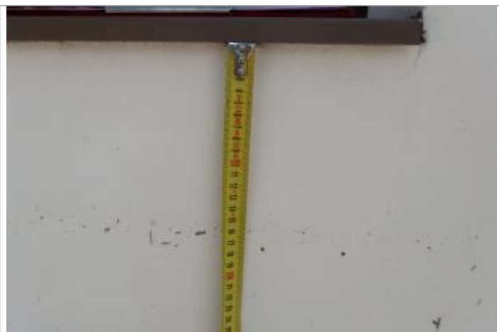
Détail du repère

Altitude calculée de l'eau (en m) : 87.48