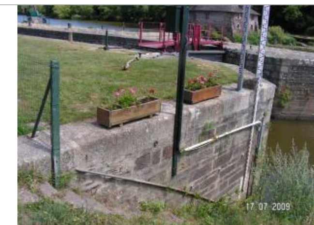
Echelle limnimétrique sur bajoyer aval de l'écluse du Boel