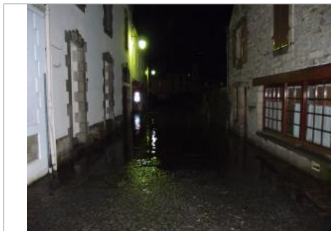
rue de l'Ellé, le 24/12/2013 à 19:42

Type de repérage : Campagne de terrain post-inondation