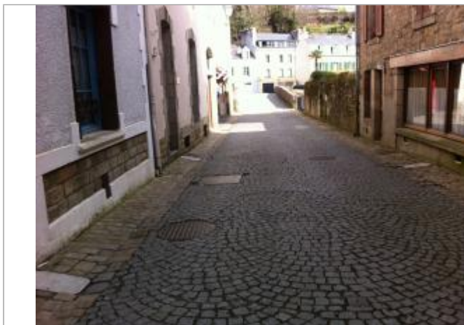
rue de l'Ellé, bâtiment au n°13