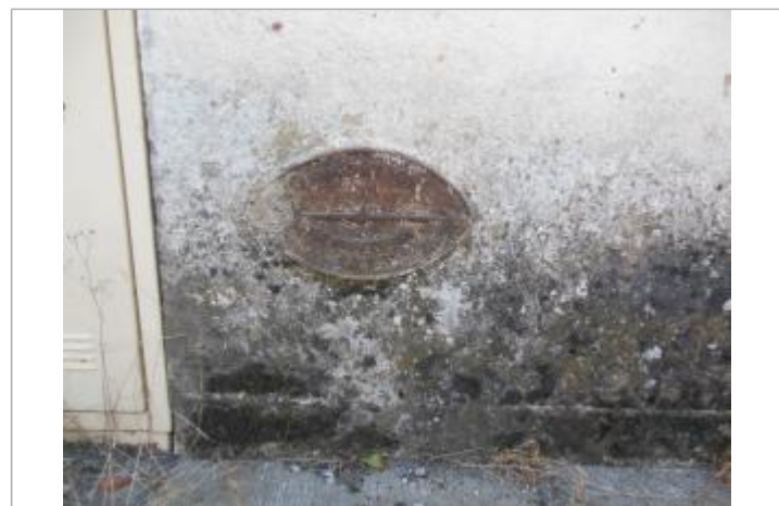
Plaque métallique située sur la façade Nord-Ouest du bâtiment situé derrière la pépinière d'entreprise à 45 cm au-dessus du sol

GÉNÉRAL Code : WEB_R_201611302251 Date de mise à jour : 03/09/2020 Auteur : Syndicat des 3 Rivières