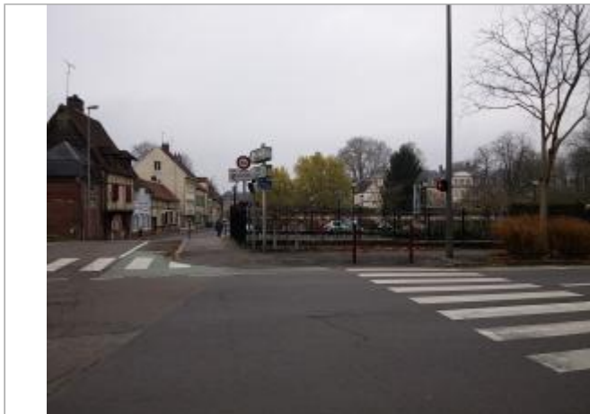
Site du pont sur le Thérain rue de Cambry