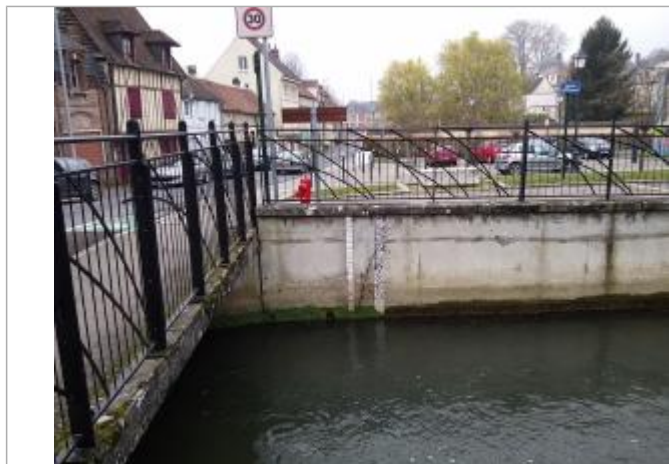
Echelle amont rive droite pont de Cambry sur le Thérain