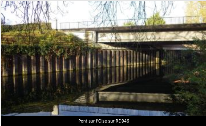
Pont sur l'Oise sur RD946

GÉOLOCALISATION Coordonnées WGS84 : X: 3.63044349 / Y: 49.89764760 Coordonnées RGF93 (Lambert 93) X: 745332.8 / Y: 6977841.53 Coordonnées RGF93 (ETRS89) : X: 3.6304435 / Y: 49.8976476