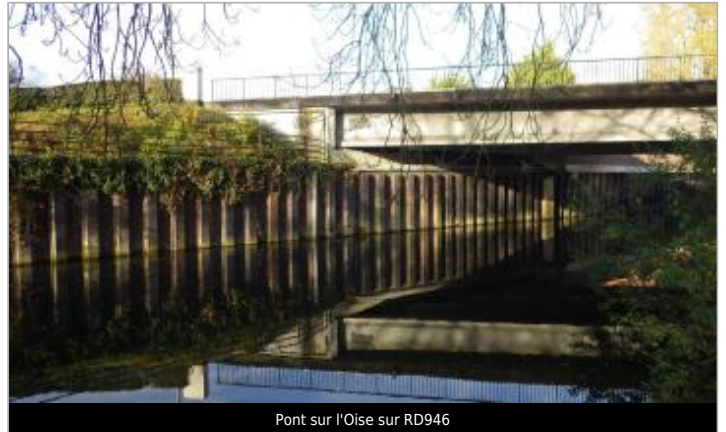
Pont sur l'Oise sur RD946