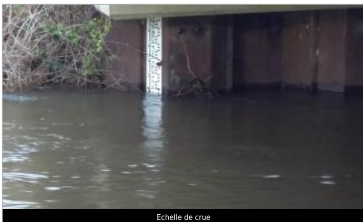
Echelle de crue