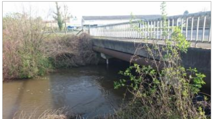
Pont sur l'Avelon à Goincourt