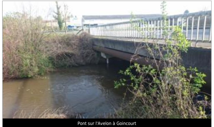
Pont sur l'Avelon à Goincourt