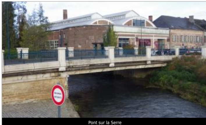
Pont sur la Serre