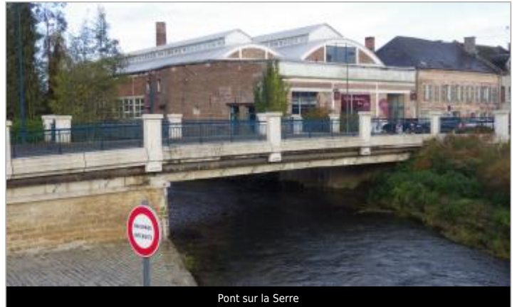
Pont sur la Serre