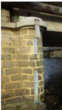
Echelle de crue en aval du pont sur la Serre, rive gauche