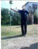
152 rue de Quatre Ages.

SOURCE DE REPÉRAGE : CAMPAGNE AÉRIENNE SDIS 76 - 05/06/2016