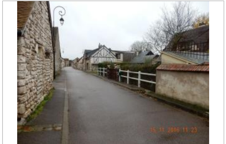
152 rue de Quatre Ages