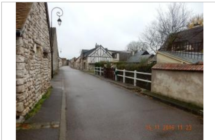
152 rue de Quatre Ages