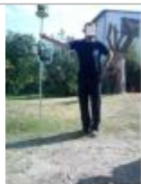
152 rue de Quatre Ages.

SOURCE DE REPÉRAGE : CAMPAGNE AÉRIENNE SDIS 76 - 05/06/2016