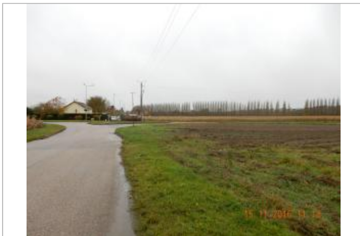
Proche du calvaire rue du Barrage ( le Rivage )