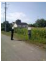
Proche du calvaire rue du Barrage Martot

Altitude calculée de l'eau (en m) : 6.58