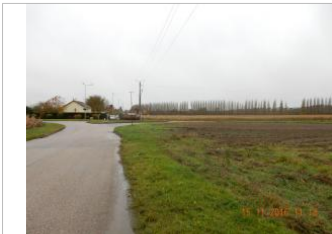
Proche du calvaire rue du Barrage ( le Rivage )

Coordonnées WGS84 : X: 1.06415550 / Y: 49.29937400