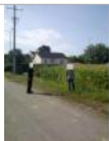
Proche du calvaire rue du Barrage Martot