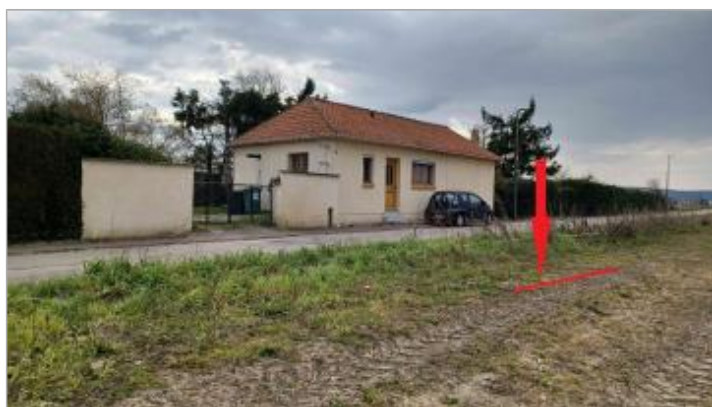
Le champ en face du 5 rue du Barrage