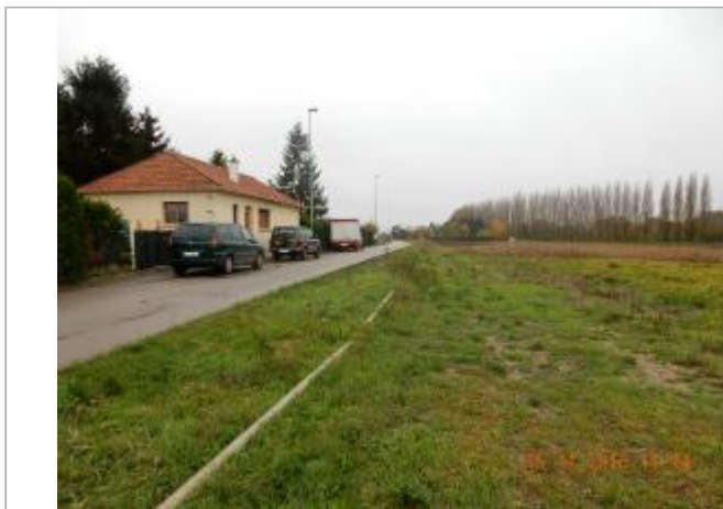
Le champ en face du 5 rue du Barrage

Coordonnées WGS84 : X: 1.06201980 / Y: 49.29868900