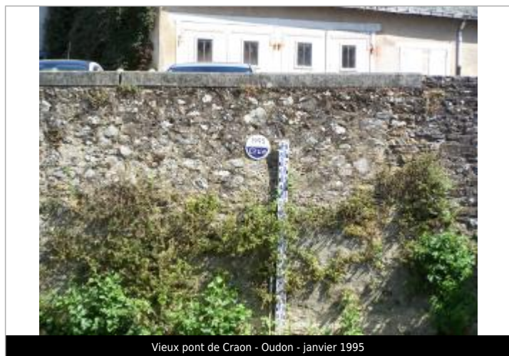
Vieux pont de Craon - Oudon - janvier 1995