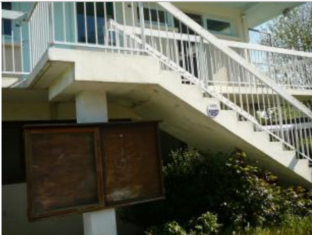
camping du Lion d'Angers - Oudon - janvier 1995