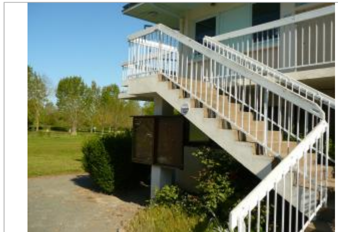
camping du Lion d'Angers