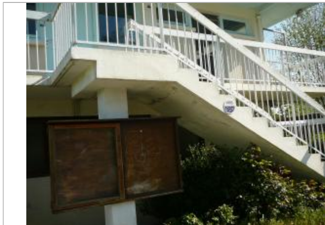
camping du Lion d'Angers - Oudon - janvier 1995