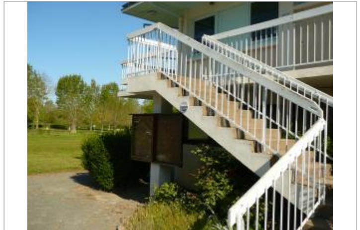
camping du Lion d'Angers