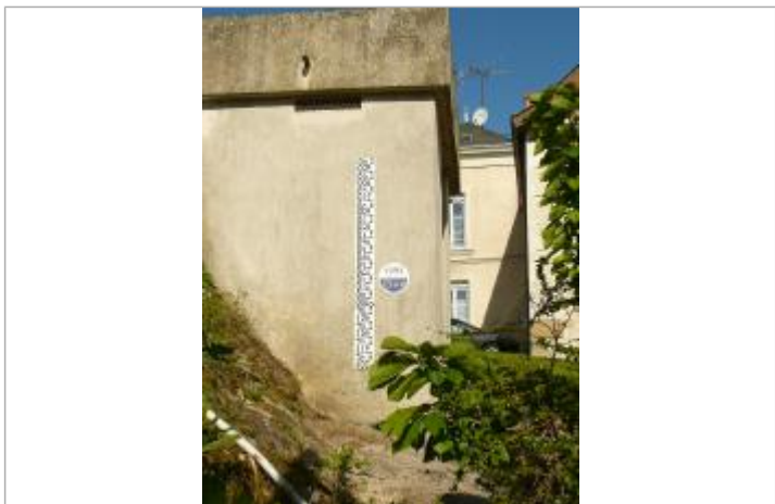
Halte nautique du Lion d'Angers - janvier 1995

GÉNÉRAL Code : WEB_R_201611033928 Date de mise à jour : 29/06/2020 Auteur : symbolip