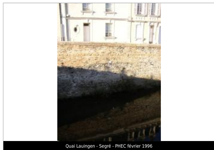
Quai Lauingen - Segré - PHEC février 1996