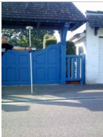
Laisse de crue sur le sol du trottoir