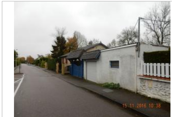
17 rue de Freneuse