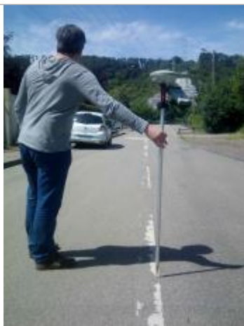
Rue René Sortemboc

Altitude calculée de l'eau (en m) : 5.88 m