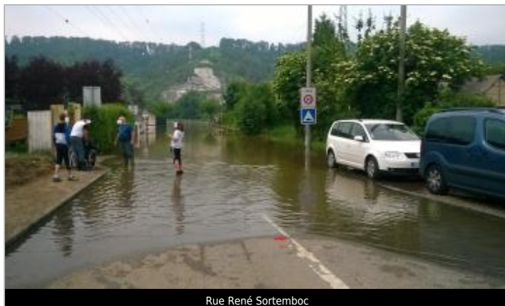
Rue René Sortemboc

Coordonnées WGS84 : X: 1.03035500 / Y: 49.32106800