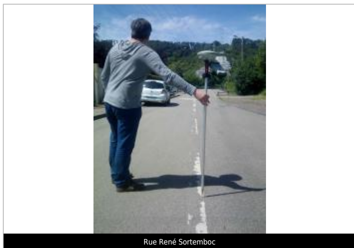
Rue René Sortemboc

SOURCE DE REPÉRAGE : VISITE TERRAIN DREAL NORMANDIE - 05/06/2016