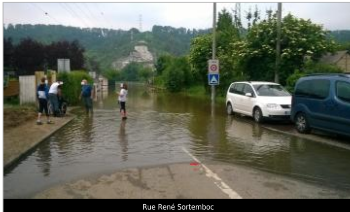
Rue René Sortemboc

Coordonnées WGS84 : X: 1.03035500 / Y: 49.32106800