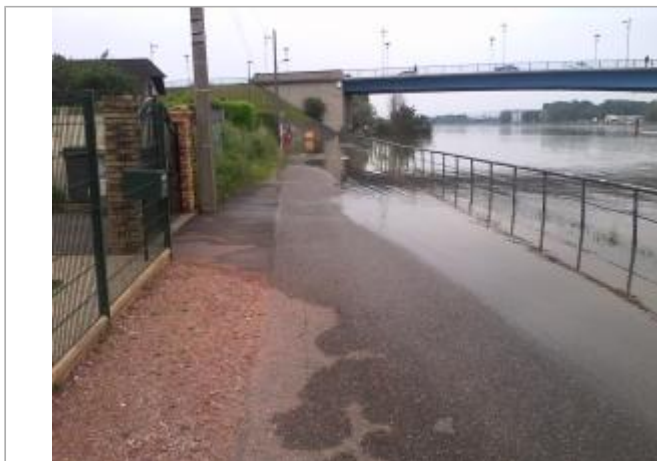
Entrée du 760 chemin de halage à SAINT-AUBIN-LES-ELBEUF

Coordonnées WGS84 : X: 1.00924000 / Y: 49.29442600