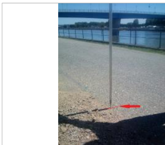
Laisse de crue au sol sur la chaussée.