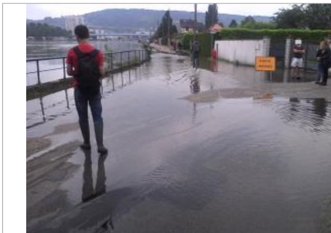
A l'aval du pied du pont amont de Saint-Aubin-Les-Elbeuf