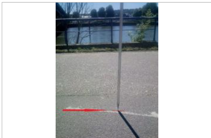
Sol de la chaussée, Chemin du Halage (proximité du pont Jean Jaures)

Altitude calculée de l'eau (en m) : 6.19 m