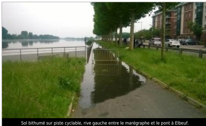
Sol bithumé sur piste cyclable, rive gauche entre le marégraphe et le pont à Elbeuf.